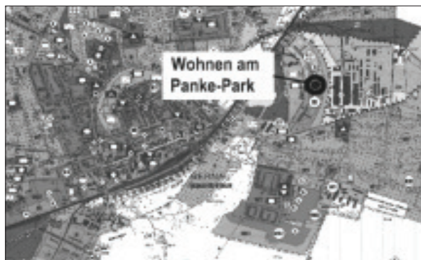
Übersichtsplan zur 4. Änderung des Flächennutzungsplans „Wohnen am Panke-Park“